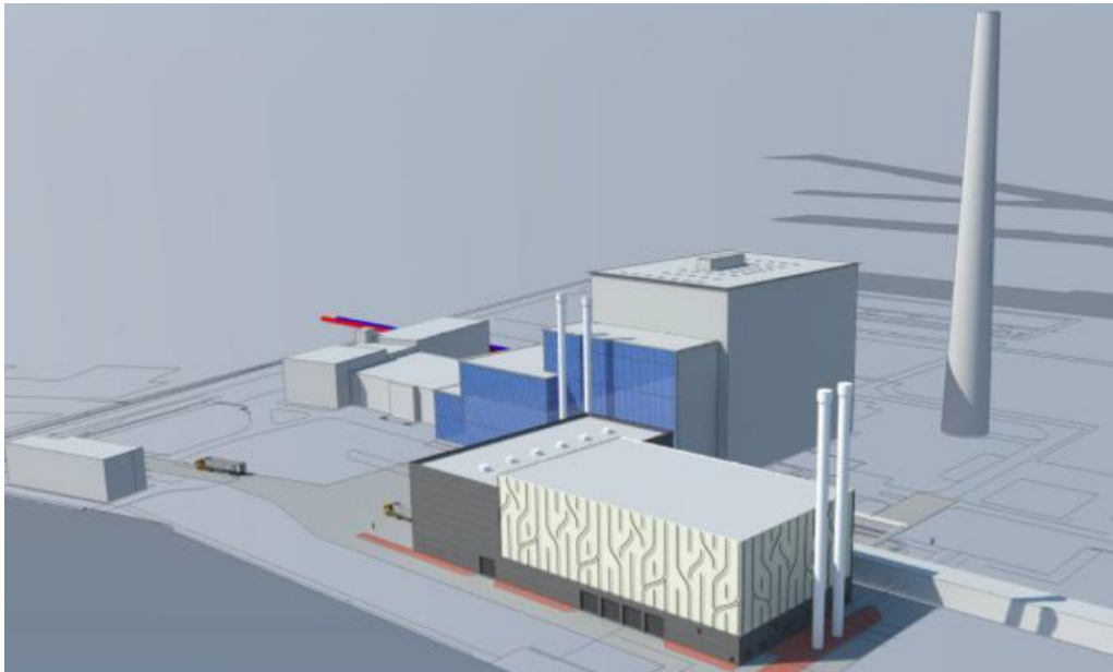
Ontwerp biomassawarmtecentrale Eneco op Lage Weide Utrecht

met aardgas zo'n 300 % hoger. Dat wordt niet goedge maakt doordat biomassa weer aangroeit (zie paragraaf 6).